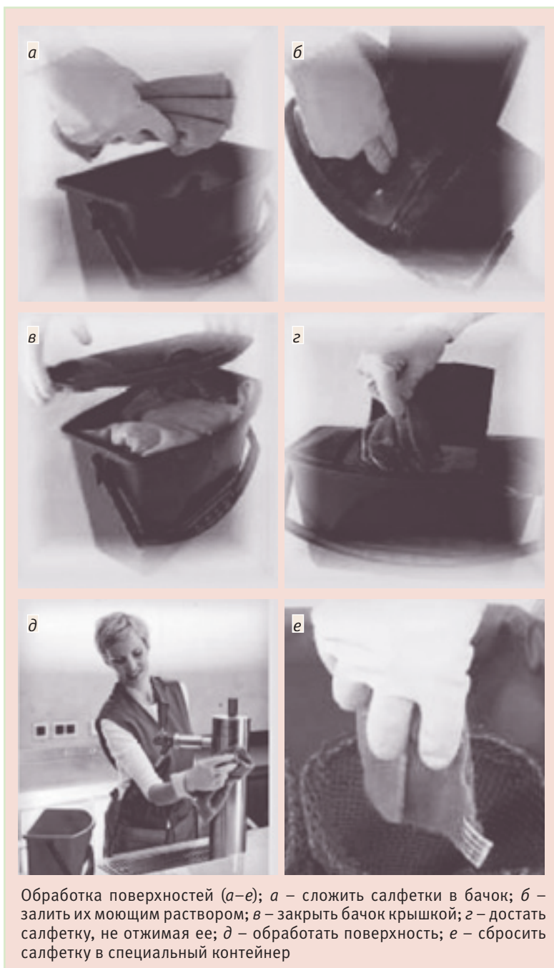
Обработка поверхностей (а–е); а – сложить салфетки в бачок; б – залить их моющим раствором; в – закрыть бачок крышкой; г – достать салфетку, не отжимая ее; д – обработать поверхность; е – сбросить салфетку в специальный контейнер

микробной обсемененности); при генеральной уборке проводятся мытье, очистка и обеззараживание поверхностей помещений (в том числе – труднодоступных), дверей, мебели, оборудования (в том числе – осветительных приборов), аппаратуры с использованием моющих и дезинфицирующих средств и последующим обеззараживанием воздуха.